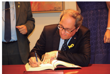
FOTOGRAFIA 35. El president de la Generalitat, M. Hble. Sr. Quim Torra, signant el llibre d'honor de l'IEC.