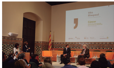
FOTOGRAFIA 16. El president de l'IEC participant en el Simposi de la Fundació La Marató de TV3.