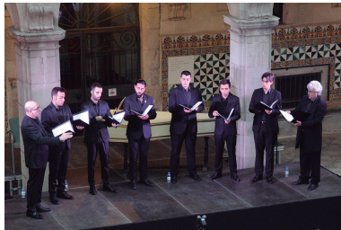
FOTOGRAFIA 32. De Canendi Elegantia. Concert del 27 de juny.