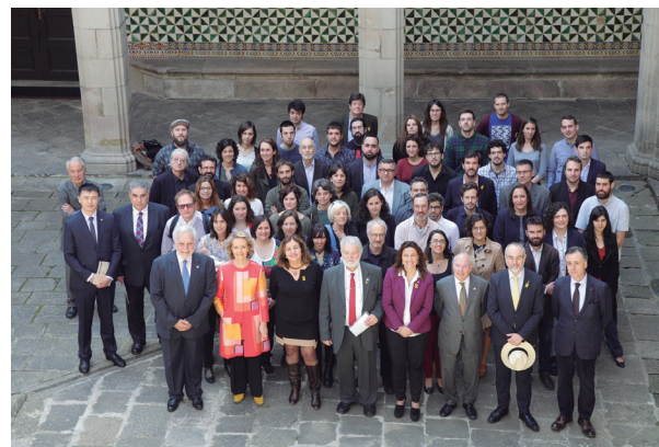
FOTOGRAFIA 36. Els premiats amb Francesca Tur, consellera de Cultura, Participació i Esports del Govern de les Illes Balears; Mercè Conesa, presidenta de la Diputació de Barcelona, i l'Equip de Govern de l'IEC.