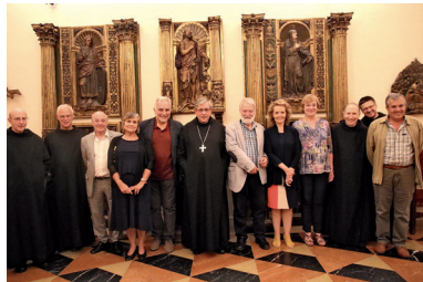
FOTOGRAFIA 17. Els membres del Consell Permanent de l'IEC a l'abadia de Montserrat.