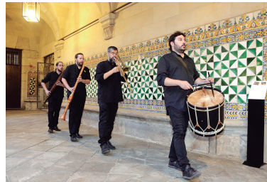
FOTOGRAFIA 33. La Caravaggia. Concert del 5 de juliol.