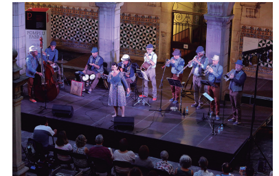
FOTOGRAFIA 34. La Cobla Catalana dels Sons Essencials. Concert del 12 de juliol.