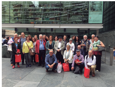
FOTOGRAFIA 29. La Ruta Pompeu Fabra a Bilbao.