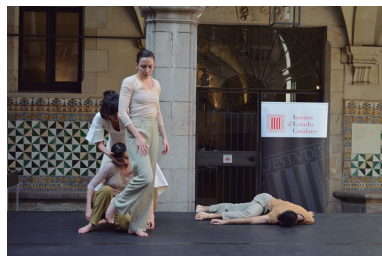
FOTOGRAFIA 21. L'espectacle de dansa Entre viatges i flors .