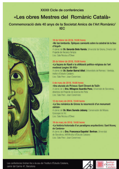
FOTOGRAFIA 10. Programa del cicle.