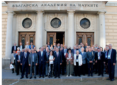
FOTOGRAFIA 15. Els membres de l'Assemblea General de l'ALLEA davant l'Acadèmia de les Ciències de Bulgària (Sofia).