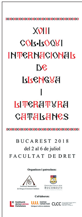
FOTOGRAFIA 19. Cartell del Col·loqui.

L'IEC és una de les vint-i-una institucions que formen el Patronat d'Honor del Centenari de l'Euskaltzaindia, acadèmia de la llengua basca constituïda el 25 de gener de 1918 a proposta dels diputats nacionalistes Koxme Elgezabal i Felix Landaburu. El president de l'IEC va assistir a l'acte de constitució del Patronat d'Honor, que va tenir lloc al Palau Foral de la Diputació de Biscaia i que fou seguit de la sessió plenària de juliol, a la qual van ser convidades totes les acadèmies que integren el Patronat.