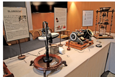
FOTOGRAFIA 30. Les maquetes del giroscopi i de la gravadora de so, de l'exposició sobre els invents que han revolucionat el món.

Organitzada per la Universitat Jaume I i la Fundació Germà Colón.