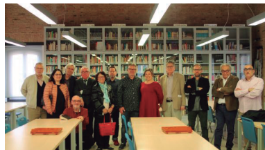
FOTOGRAFIA 14. La Junta Directiva de l'SCC amb l'alcaldessa i el regidor de Cultura de Sueca.