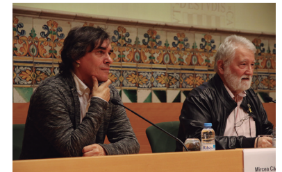
FOTOGRAFIA 24. Mircea Cărtărescu en la seva intervenció, acompanyat pel president de l'IEC.