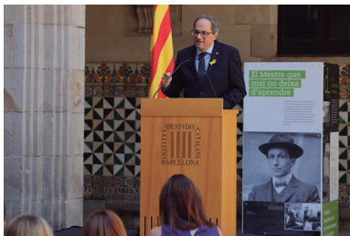
FOTOGRAFIA 27. El president de la Generalitat durant el seu parlament.